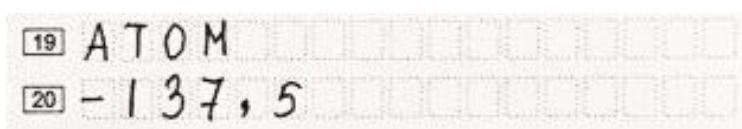
Рис. 1. Образец заполнения полей на бланке ответов № 1

Ответ на задание с кратким ответом нужно записать в такой форме, в которой требуется в инструкции к данному заданию (или группе заданий), размещенной в КИМ перед соответствующим заданием или группой заданий (рис. 1).